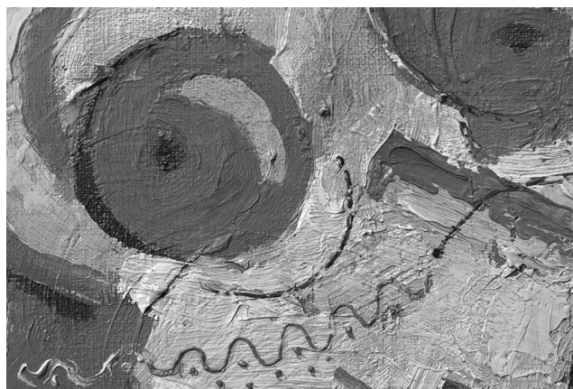
Priblížený detail digitálnej reprodukcie vytvorenej veľkoplošným skenerom

Rozdiel je priam odzbrojujúci a predstava, že budeme mať postupne zdigitalizovaný celý zbierkový fond v takejto kvalite, je vzrušujúca. Tu sa jemne dotknem reakcie z úvodu, ktorá súvisí s hologramami. Tam zatiaľ nie sme, hoci treba povedať, že nič nie je nemožné. Možno už o pár rokov budeme pozývať na výstavy, ktorých súčasťou budú 3D hologramy. Tak ako napreduje čas, aj jednotlivé diela sa stávajú citlivejšie a chúlостivejšie na prezentáciu na výstavách alebo na ich transport, preto sa digitálne reprodukcie originálov, či už v tlačenej alebo digitálnej podobe, skôr či neskôr stanú neoddeliteľnou súčasťou výstavnej činnosti galérií. Návštevníci neprídu o kvalitu, dokonca dostanú pridanú hodnotu a originály ostanú chránené v bezpečných depozitároch.